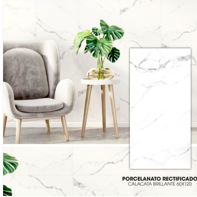
PORCELANATO RECTIFICADO CALACATA BRILLANTE 60X120

MUNDO SELECTO PORCELANATO CALACATA BRILLANTE 1133P544704201